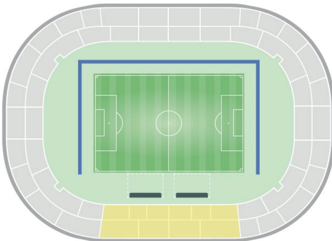
Detalle de la ubicación de las entradas preferenciales.

En ningún partido tendrán preferencia, en cuanto a las mejores ubicaciones del estadio, los socios o los abonados del Club local sobre los Patrocinadores Oficiales de la Competición y la CONMEBOL. Las ubicaciones definidas para ambas categorías de entradas deberán ser las enviadas y previamente aprobadas en el documento Mapa de Asientos 2024